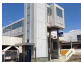
J R 網干駅