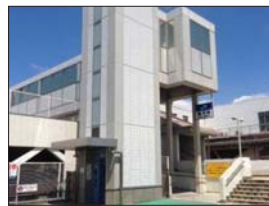
J R 網干駅