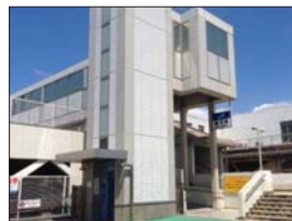
J R 網干駅