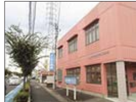
よしかた内科クリニック