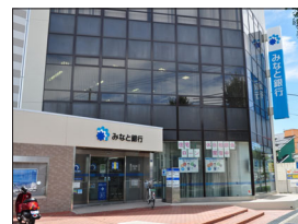
みなと銀行舞子支店